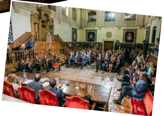
Entrega del I Premio Francisca de Pedraza, 2016